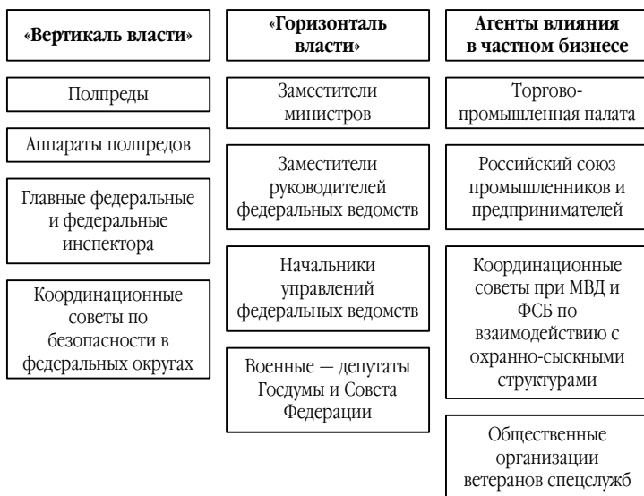
Рис. 2. Коалиция Путина

Правда, военные «путинского призыва» прошли школу демократизации, работали в коммерческих структурах или за границей. Их внутренний авторитаризм трансформировался, стал условнее. Стремление к тотальному контролю ограничено теперь рамками закона, западными стандартами, оглядкой на реакцию мирового сообщества. И все же, мирясь с