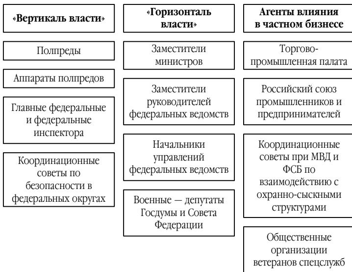
Рис. 2. Коалиция Путина

Правда, военные «путинского призыва» прошли школу демократизации, работали в коммерческих структурах или за границей. Их внутренний авторитаризм трансформировался, стал условнее. Стремление к тотальному контролю ограничено теперь рамками закона, западными стандартами, оглядкой на реакцию мирового сообщества. И все же, мирясь с